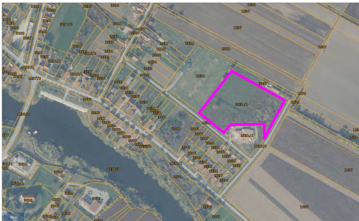
kčbr. 3331/2 k.o. NIJEMCI NA DIGITALNOJ ORTOFOTO KARTI 2019/20